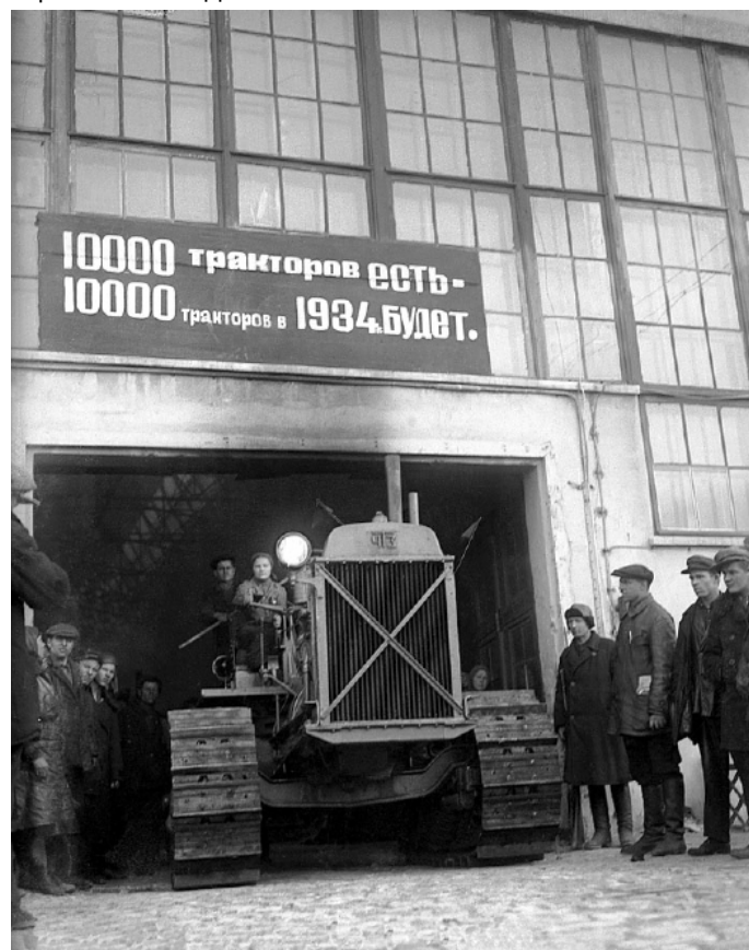
Челябинский тракторный завод выпуск 10-тысячного трактора 1930-е годы